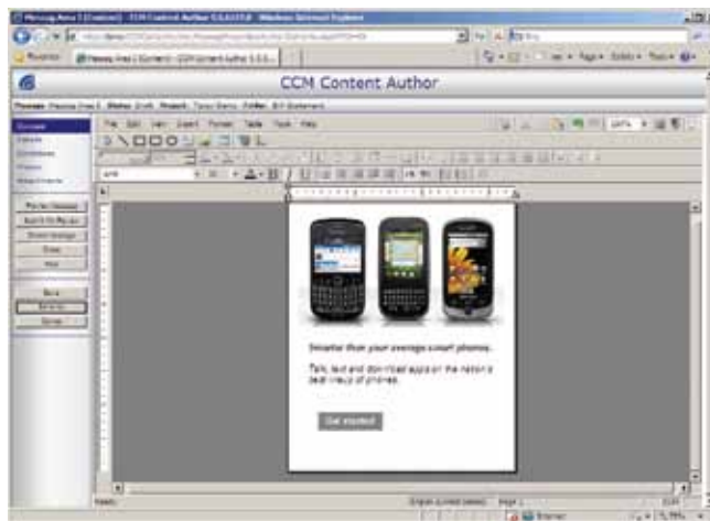
DOC1 Content Author

Os usuários podem classificar e controlar a prioridade das mensagens tomando como base a importância e podem programar por data, valor do dado ou outras condições personalizadas. O sofisticado gerenciamento do espaço em branco estabelece o número ideal de mensagens na página, tomando como base o estado real disponível e a prioridade das mensagens. E, com a edição e a aprovação de mensagens pela Web, você pode distribuir essa poderosa funcionalidade sem o suporte extensivo de TI e sem prolongados testes e ciclos de revisão. O Content Author também oferece opções extensivas de administração para gerenciar usuários, projetos e processos.